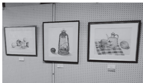
地域文化祭での展示