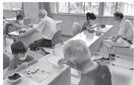
夏休み子ども体験教室のようす