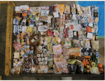
燃やせるごみに含まれる食品ロス