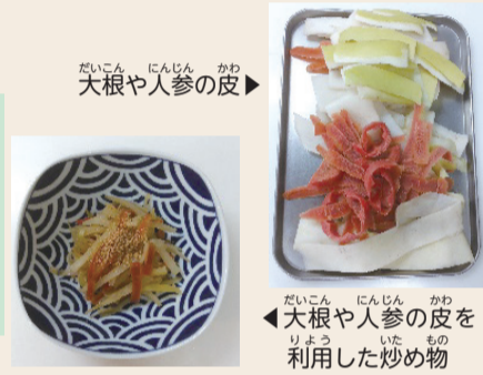
大根や人参の皮を 利用した炒め物

料理レシピサイトブックパッド「消費者庁のキッチン」では、リメイクレシピや食材を使い切るレシピをたくさん掲載していますのでぜひご覧ください。