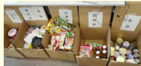
◀フードドライブで集まった食品(一部)