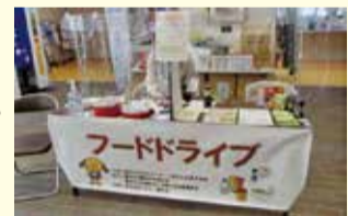
◀市役所2階総合案内所前のフードドライブの様子

このマークは音声コード「Uni-Voice」です。専用のアプリを使って音声データを聞くことができます。