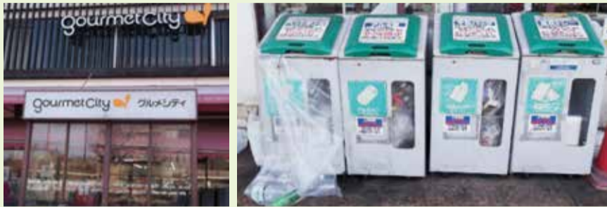
ごみ減量・リサイクル協力店 株式会社ダイエー グルメシティ神代店

「ごみ減量・リサイクル協力店」では、調布市のごみ減量やリサイクル活動を推進していただいています。