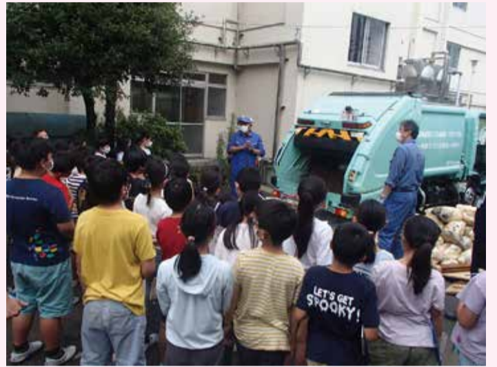
ごみ収集車見学・体験の様子