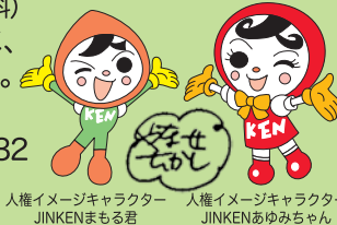
人権イメージキャラクター JINKENまもる君 人権イメージキャラクター JINKENあゆみちゃん