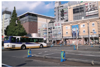
調布駅前広場のトイレと調布市の公共交通

問 調布駅前立地し、様々な機能を担うことが期待され、整備が進められている調布駅前広場の公衆トイレ建設について①女性や、高齢者・障害者の視点を取り入れるのか②いつでも快適に利用できることが重要であり、ごみのないきれいな状態を長く維持するため、どのようなトイレとしていくのか。 環境部長 ①整備方針定め、公衆トイレの基本性能備えつつバリアフリー化やユニバーサルデザイン採用②清潔さ持続のため、使用済おむつ等を廃棄できるサニタリーボックス設置。清掃しやすい水洗いできる床材とする。 問 トイレ建設後、清潔な状態を長く保つため、維持管理をどのように行うのか。 環境部長 施設内への家庭ごみ放置が問題。注目集まる渋谷区公衆トイレ清掃事業者から助言受け維持管理方法の検討を進める。 問 新型コロナウイルス感染症の影響や要員不足、燃料費の高騰など、バス運行事業者を取り巻く厳しい現状に対する認識は。 市長 バス事業者との課題共有や、今後の取組に向けた連携強化が重要であると認識。 問 北部地域デマンド型交通実証実験について①導入までの経緯と目的は②運行概要と、運行