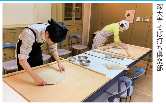
深大寺そば打ち倶楽部