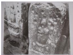
石仏についた凹み

子どもの生活では、季節に応じて様々な遊びが行われてきました。なかでも春の「ままごと遊び」は古くから幼児に人気のあるもので、調布では明治時代ごろまで「草つき」とよばれていました。この遊びは神社やお寺の境内で行われることが多く、石地藏や灯籠の台石の丸い凹みに、ヨモギやハスの葉を入れてコツコツと石で叩き、餅状にして地藏などに供えたり、「ままごと」をしたりしました。