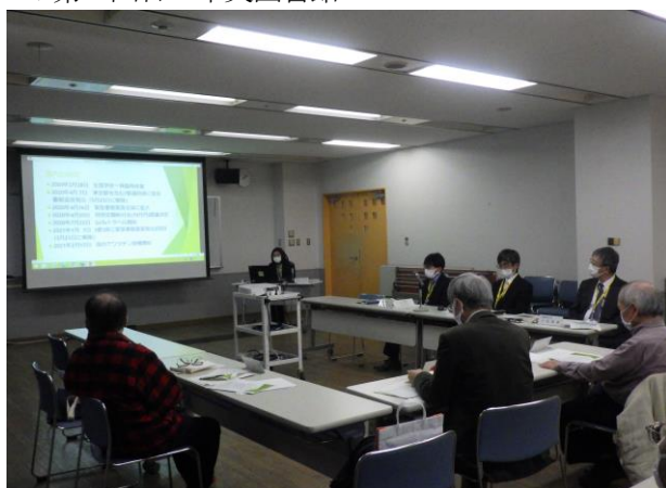
▼第2回目 中央図書館