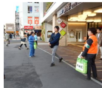
喫煙マナーアップキャンペーンの様子