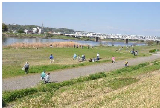
＜多摩川クリーン作戦の様子＞