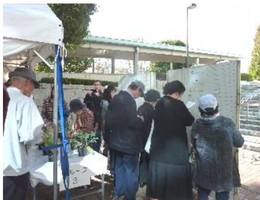
<第42回調布市農業まつりの様子>