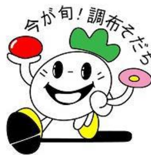
調布産農産物ブランドキャラクター