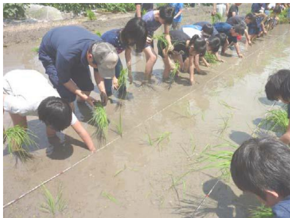
学童農園における田植えの様子