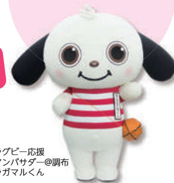
ラグビー応援 アンバサダー@調布 ラガマルくん