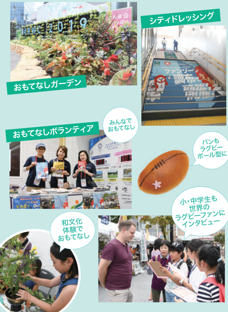
おもてなしガーデン