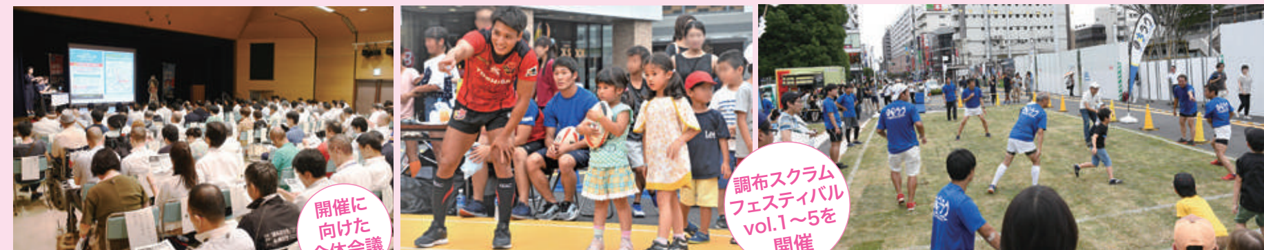
開催に 向けた 全体会議

「オール調布」の視点に立った取り組みを進めるため、調布市2019-2020プロジェクト全体会議を4回開催。調布スクラムフェスティバルもvol.5まで実施しました