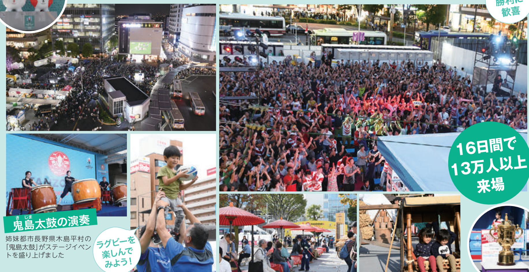
日本の 勝利に 歓喜