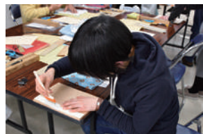
前回の製本講座の様子

締切後、定員に空きがある場合は1月24日(金)午前9時～2月5日(火)午後5時に電話で受け付け(先着順)