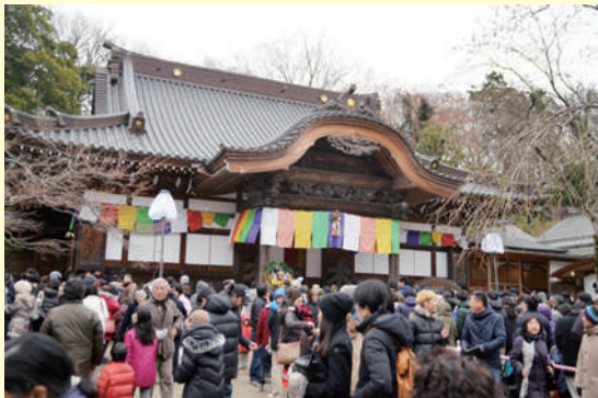
調 深大寺 ☎486-5511