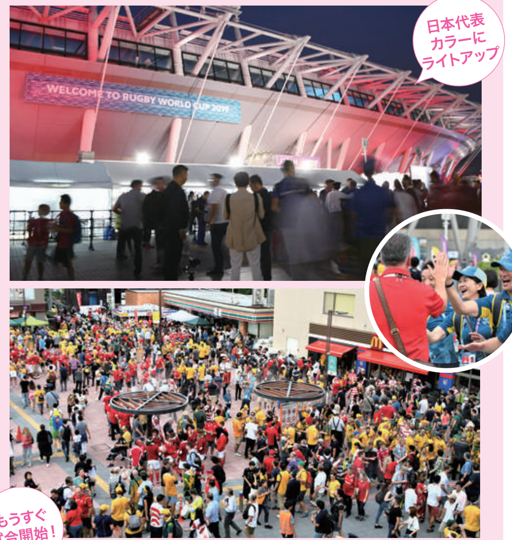
日本代表 カラーに ライトアップ