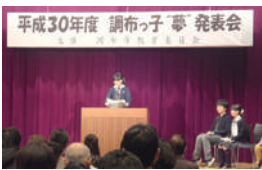
図 社会教育課 ☎481-7490