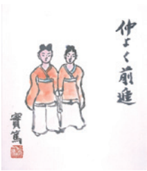
武者小路実篤 「仲よく前進」 1955年頃