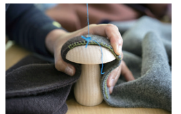
ダーニングマッシュルーム

申 Eメールの件名に「手工芸教室「ダーニング」、本文に住所または勤務先住所、氏名(ふりがな)、年齢、電話番号を明記し、5月16日(月)までに toubuk@w2.city.chofu.tokyo.jp