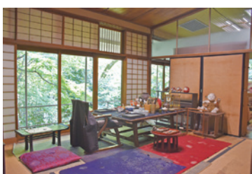
旧実篤邸(仕事部屋)