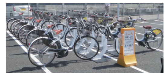
サイクルステーション