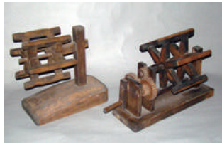
牛首(左)と座繰り(右)