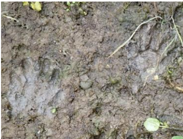
モミジ型の足跡 大きさは約6~7cm