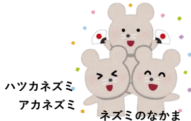
ハツカネズミ アカネズミ