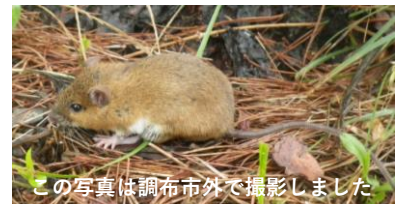
この写真は調布市外で撮影しました