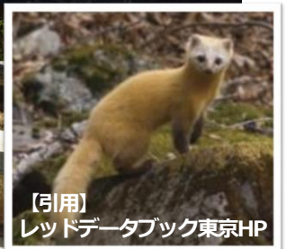
【引用】 レッドデータブック東京HP