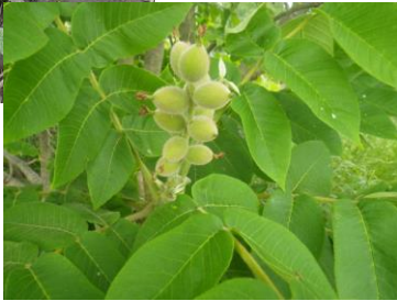
参考：熟す前のオニグルミ