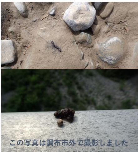
この写真は調布市外で撮影しました