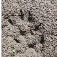
小さな足跡 大きさは約2cm