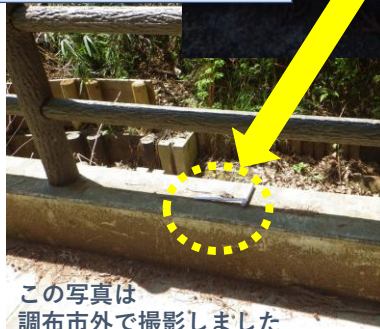
この写真は 調布市外で撮影しました