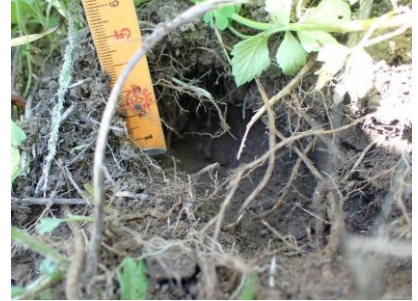
捨てられた土をどかしたところ 穴は直径4～6cmくらい