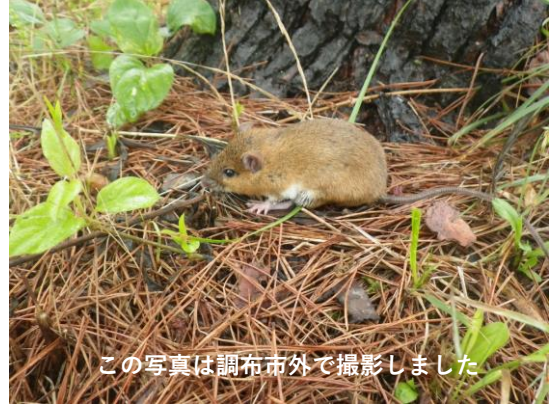
この写真は調布市外で撮影しました