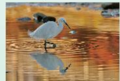
市内部門・多摩川自然情報館入賞 【水鳥】

当館には駐車券がありません。 車での入館はご遠慮ください。 (最寄りのコインパーキングをご利用ください) 公共交通機関、自転車をご利用ください。(自転車はあきません。)