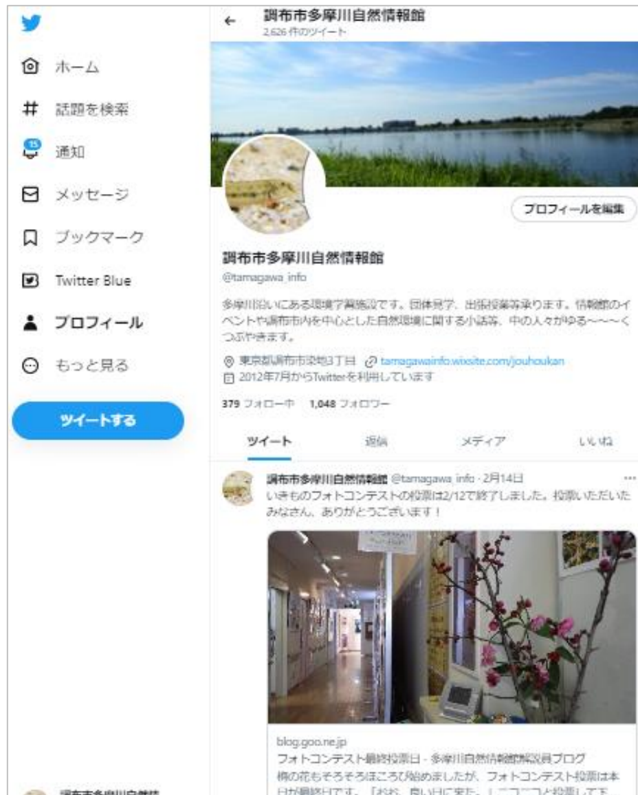
図5-1-21 twitter更新内容の一例