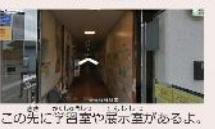
この先には学習室や展示室があるよ。