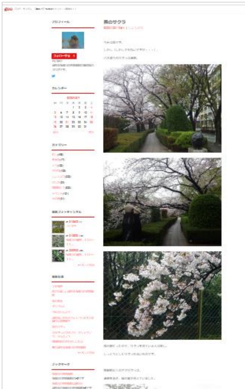
図5-1-20 解説員ブログ更新内容の一例

解説員ブログは、解説員の日常業務の一環として、解説員が館内で勤務する際に更新した。また、月別イベント等のイベントが実施された後にイベントレポートを掲載し、イベントの状況を発信した。