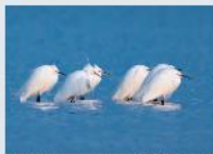
多摩川野鳥、多摩川自然情報館大賞「白鷺無双」

調布市では、市内の自然環境の再発見と、生物多様性への理解を深める目的で、「調布市いきものフォトコンテスト2022」を開催しています。市内に生息する野生のいきものを主体とした写真を募集し、応募作品を調布市多摩川自然情報館で展示します。応募作品の中から来館者の投票や専門家の評価などにより入賞作品を決定します。