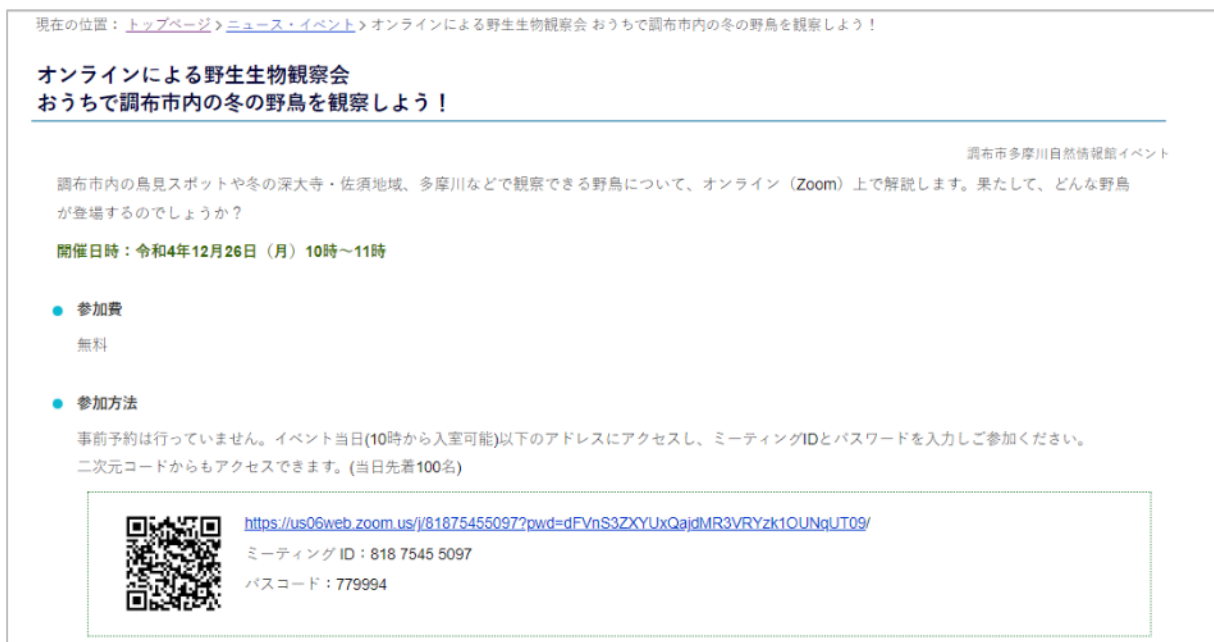
図 5 - 1 - 19 ホームページ更新内容の一例

館の行事予定、活動記録等についてホームページの内容を更新し、情報発信を行った。イベントや休館日、展示内容のリニューアル等により、適宜掲載内容を見直し、情報を更新した。