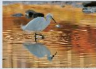
市内野鳥、多摩川自然情報館大賞「水鏡」