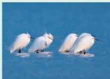
多摩川部門・多摩川自然情報館入賞 【白鳥(野鳥)賞】

応募作品65点の中から、来館者の投票と専門家の評価により「多摩川部門」、市内部門それぞれの実賞作品が決定しました。たくさんのご応募、ありがとうございました。