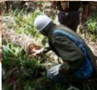
普通に伐採したシュロは根が残り、またすぐ芽生えてしまう。

昨夏作った落ち葉だめの周囲には、キツネのカミソリが増えていました。落ち葉かきについては、土に適当な光と水分を与えることで埋土種子の発芽やみみずなどが土の攪拌を促すことから、時期の大切さ、下草刈りの必要性などが話されました。落ち葉だめも半分づつの活用が提案されました。