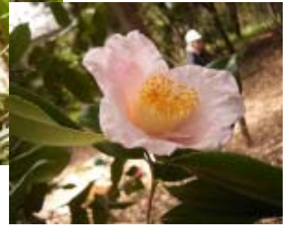
ツバキ(園芸品種?) 淡い色合いがなんともすてき!