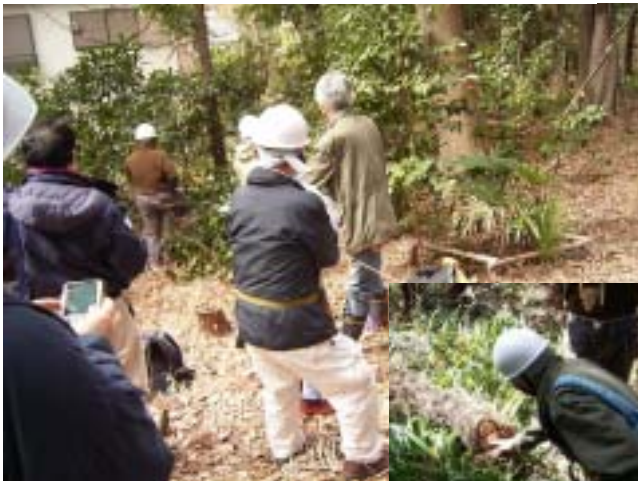
滑車を使用しての低木の引き抜き。根を残すことなく除去できる。