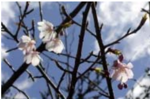
ハリウッド大寒桜のことも 調布ヶ丘3丁目