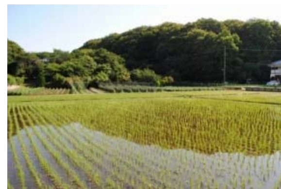
作品名「夏に向かって」

た。応募いただいた42作品について、2月2日に市民プラザあくろすで実施した「深大寺・佐須地域の農を活用したまちづくりシンポジウム」での来場者等の投票により、次の5作品が入賞しました。