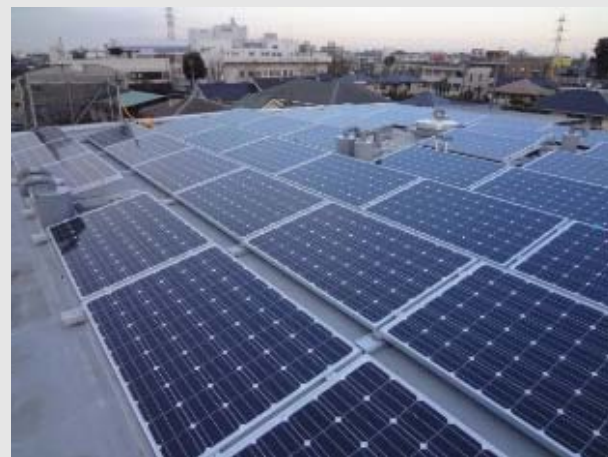
山野市営住宅 B 棟