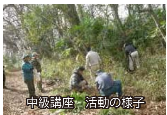
中級講座 活動の様子

中級講座は、雑木林の保全活動で一番手を焼くシュロの除去方法について学習しました。今後の活動に役立つ技術を共有することができました。