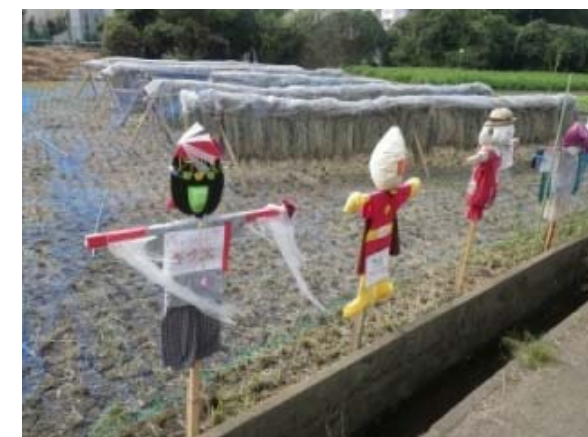
作品名 「佐須用水と案山子と天日干し」