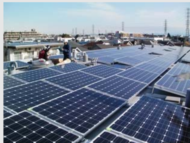
山野市営住宅 A 棟

なお、【本事業における市や市域のメリット】に記載の予定事業は、本協議会を通じ、市民参加の機会を設けながら検討・推進していく予定です。