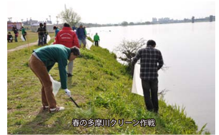
春の多摩川クリーン作戦