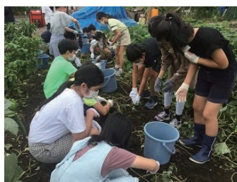
令和3年9月14日の子どもたちの稲刈り・さつまいも掘り体験の様子