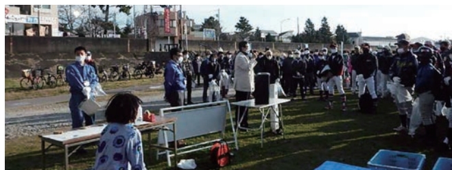
秋の多摩川クリーン作戦の様子

可燃 260kg 不燃 200kg 粗大ごみ 200kg ビン 36本 缶 284本 ペットボトル 932本