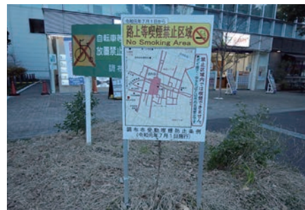
路上等喫煙禁止区域の看板