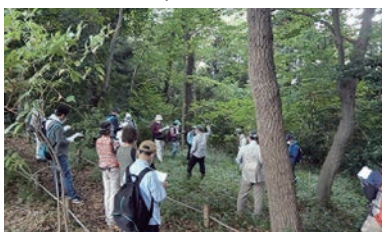
樹木調査をする様子

令和3年10月16日（土）に開催した、今年度第3回目となる講座では「雑木林はどう育て維持されていたか」について学びました。雑木林とは、自然にできた林ではなく、燃料としての薪や、肥料としての落ち葉を使うなど、人の手が入った林です。講師から、皆さんの力を借りて維持保全していきたいとの話がありました。