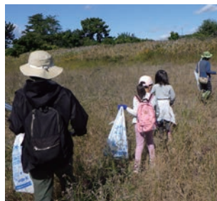
多摩川でゴミ拾い