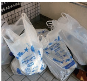
当日収集したごみ