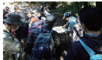
生き物を観察する様子

講義では食物連鎖の話がありました。その後、深大寺自然広場内で、実際にどんな生き物（昆虫類）が見つかるか、みんなで観察会を行いました。