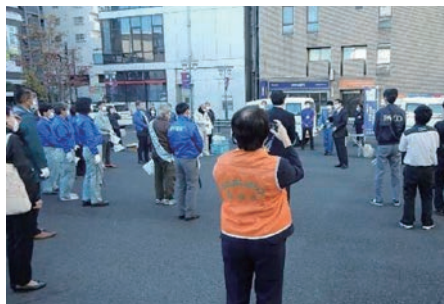
喫煙マナーアップ・受動喫煙防止キャンペーンの様子

本年も自治会や商店会、事業者の方など合計で34団体、186人と多くの方にご参加いただきました。