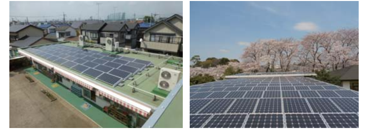
宮の下保育園 調布ヶ丘地域福祉センター ※全対象施設の設置画像は市ホームページをご覧ください。

募集人数/各回30人(先着順) 参加費/無料 持ち物/筆記用具, 飲み物, 帽子※屋上を傷つけないために, スニーカー等の靴でご来場ください。 その他/雨天決行 主 催/調布まちなか発電株式会社 申 込 み/各開催日の前日までに, 調布まちなか発電株式会社 電話: 444-1951または Eメール: info@chofu-energykyou.jp へ