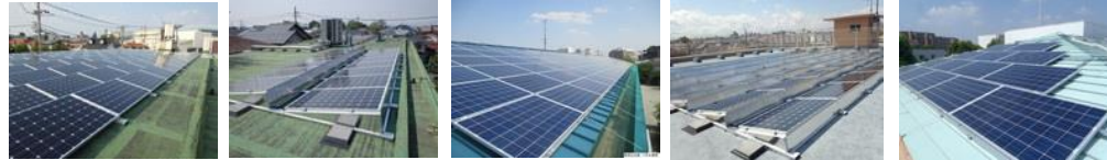
42.9 kW 9.9 kW 57.0 kW 19.4 kW 10.5 kW 上石原保育園 深大寺保育園 金子保育園 宮の下保育園・図書館 大町防災倉庫