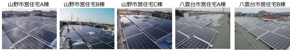
10.2 kW 23.2 kW 10.2 kW 38.8 kW 33.2 kW 山野市営住宅A棟 山野市営住宅B棟 山野市営住宅C棟 八雲台市営住宅A棟 八雲台市営住宅B棟