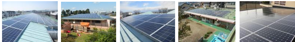
42.0 kW 38.0 kW 10.0 kW 41.6 kW 16.6 kW