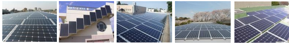
50.2 kW 11.2 kW 50.0 kW 46.7 kW 27.8 kW 東部公民館・保育園 東部児童館 西部公民館・児童館 佐須児童館・図書館 染地児童館