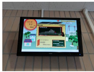
太陽光発電設備のある施設内ではモニターで現在の発電量を見ることができます