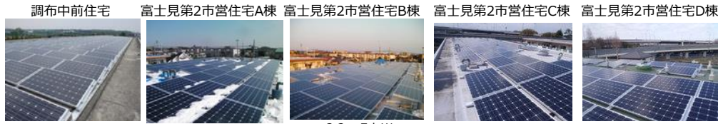
50.0 kW 20.1 kW 22.7 kW 22.7 kW 22.7 kW