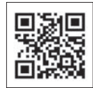
申込みメール アドレスQRコード