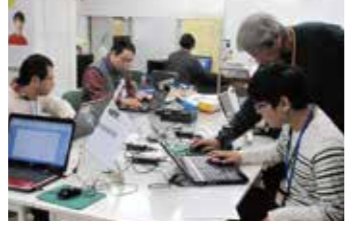
奥の部屋で生活訓練サービスを提供

■DATA/調布ドリーム 調布市飛田給2-22-7TBKビル1F TEL&FAX042-444-3068 EMAIL:info@chofudream.com Http://chofudream.com