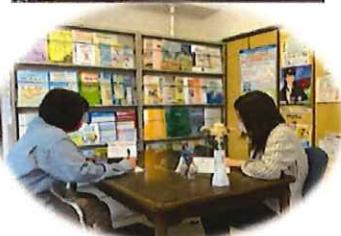
サブセンター面談風景