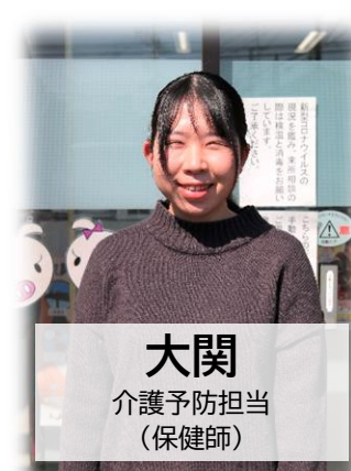
大関 介護予防担当 (保健師)