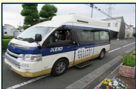
京王バスのワゴン車で運行しています

毎週火・金曜日に深大寺北町・深大寺東町を中心とした北部地域で、9時～15時台(1時間に1本)運行しています。