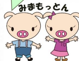
調布市見守りネットワーク 「みまもっと」キャラクター