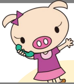
調布市見守りネットワーク 「みまもっと」キャラクター みまもっくん

調布市では、高齢者や支援が必要な方が、地域で安心して暮らしていくために、見守りネットワーク事業(通称 みまもっと)を推進しています。皆様のお近くで暮らす心配な高齢者について、何か気づいたことがありましたら、ぜひお気軽にご相談下さい！