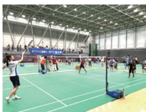
バドミントン体験会

市内に活動拠点を置くNTT東日本バドミントン部の現役選手やコーチの指導のもと、トップ選手たちが普段使用している練習場で、初心者から経験者まで幅広くバドミントンを体験できます。