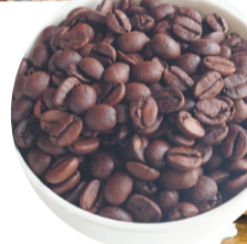
▲パービーコーヒー ロースターズ トーキョー