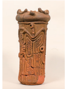
深鉢(入間町城山遺跡出土)

●ギャラリー展「おもしろいもん、文様だもん～はじめてのちょうふの縄文土器～」 日 8月30日(日)まで