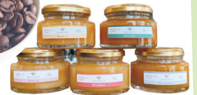
▲select shop La-La-Be 土と風と水と。