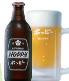
▲ホッピービバレッジ(株)