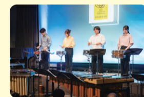
たたいてあそぼう