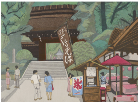
「ちょうふ八景」《深大寺》木版(1985年)