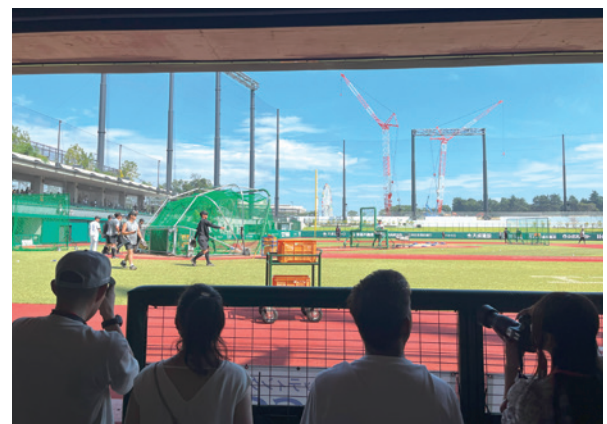
ベンチからの打撃練習見学ツアー