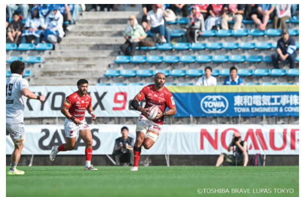
©TOSHIBA BRAVE LUPUS TOKYO