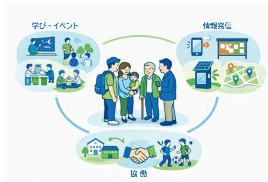
学びと参加・協働のイメージ

環境の取組は「全員が同じことをする」必要はありません。できる人が、できるときに、できる形で関わる。その輪が広がれば、調布市の環境はもっと良くなります。