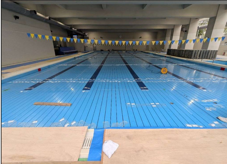
No.4 調布市立調和小学校プール可動床更新工事 可動床・床パネル 施工状況