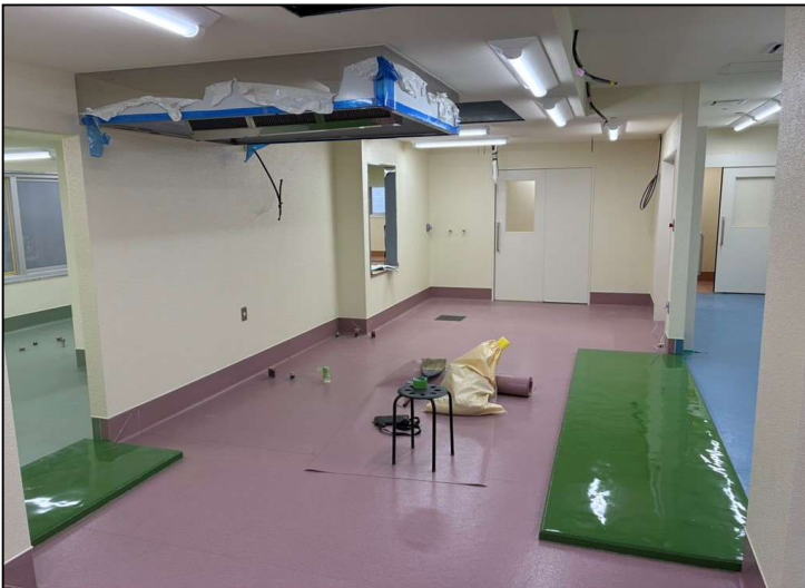
No.2 調布市立富士見台小学校給食室改修工事 内部仕上 施工状況