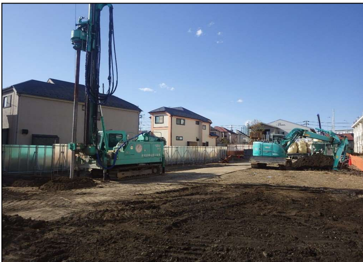
No.6 調布市立図書館宮の下分館改築工事 柱状改良 施工状況