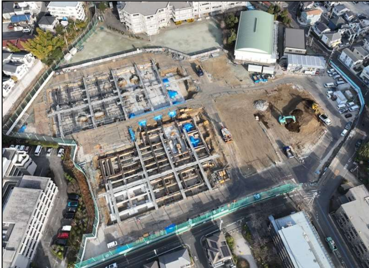
No.1 調布市立若葉小学校・第四中学校・ 図書館若葉分館施設整備PFI事業 基礎 施工状況