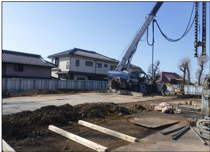
No.5 （仮称）調布市国史跡下布田遺跡ガイダンス施設新築工事 山留 施工状況