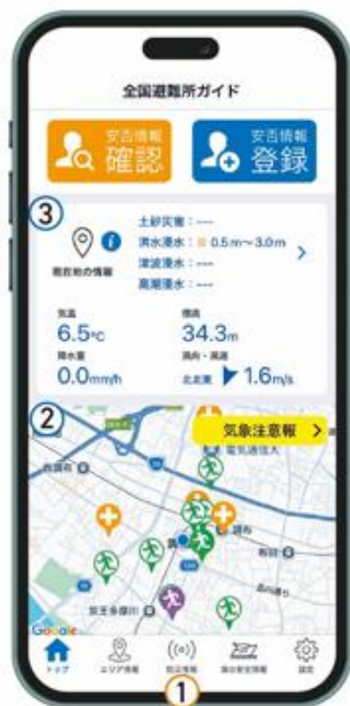
全国避難所ガイドTOP画面