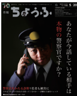
市報5月20日号 二セ警察詐欺の手口と対策