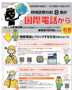
市報11月20日号 不審な国際電話対策