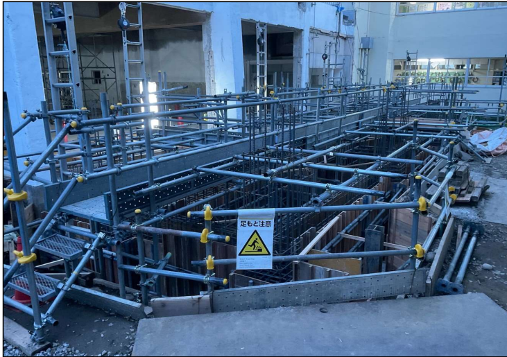
No.4 調布市立多摩川小学校給食室改修工事 増築部分基礎 施工状況