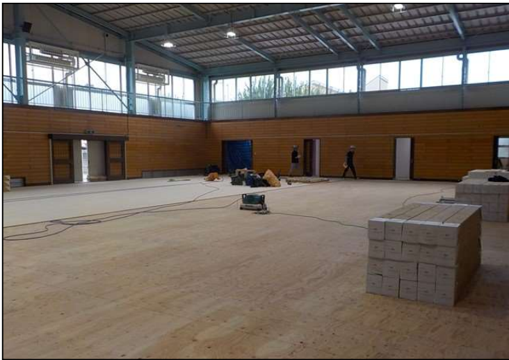
No.2 調布市立柏野小学校体育館内部改修工事 アリーナ床 施工状況