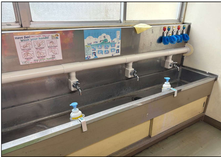
No.5 調布市立多摩川小学校給水直結化工事 水道直結化 施工完了