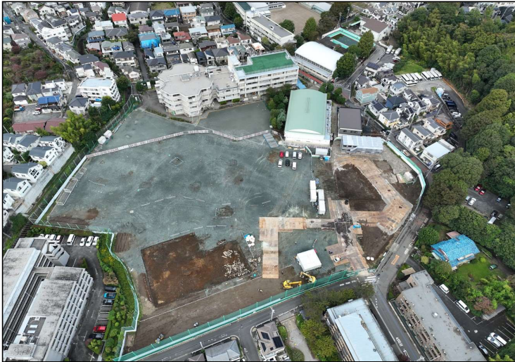
No.1 調布市立若葉小学校・第四中学校・ 図書館若葉分館施設整備PFI事業 地盤改良 施工状況