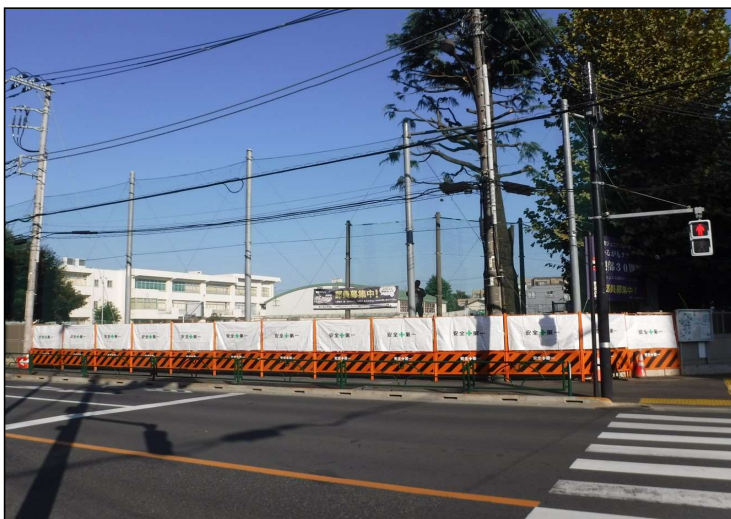
No.6 調布市立八雲台小学校西側フェンス改修工事 仮囲い 設置状況