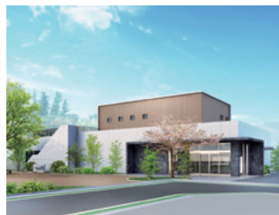
ガイダンス施設外観パース図

貴重な縄文時代の遺産を次世代に継承するため、国史跡下布田遺跡の整備を進めています。令和7年度は、国史跡下布田遺跡の情報提供や展示、体験活動などの拠点となる施設を新築するため、建築工事を進めていきます。説明会では、史跡と施設の概要や、施設工事の予定を説明します。 日 1月17日(土)午前10時～11時(9時30分開場) 所 市民プラザあくろす3階ホール 定 申し込み順80人 申 12月22日(月)から電話で郷土博物館へ