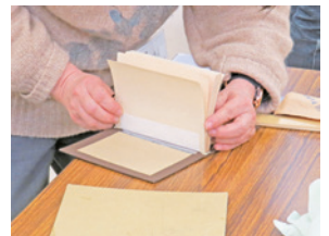
文庫本改装の様子

申 専用フォームまたは電話で、講座名、応募者全員(1回3人まで)の住所(市区町村まで)、氏名(ふりがな)、生年月日、電話番号、Eメールアドレスを1月4日(日)午後5時までに実篤記念館へ。締切後、定員に余裕がある場合は6日(火)午前9時～16日(金)午後5時に電話で受け付け(先着順)