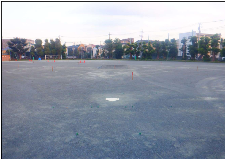
No.5 調布市立第七中学校校庭整備工事 校庭内 施工状況