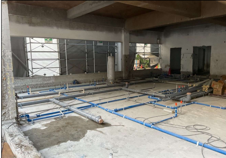
No.4 調布市立多摩川小学校給食室改修工事 給食室内部配管 施工状況