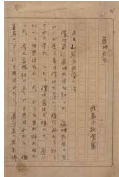
武者小路実篤「真理先生」原稿 1949年頃