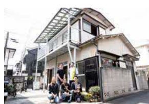
図 住宅課 ☎481-7817