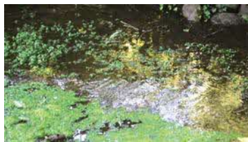
神代農場で見られる貴重な湧水

申 Eメールで件名に「神代農場散策」、本文に参加人数、参加者全員の名前・ふりがな、参加代表者の住所・電