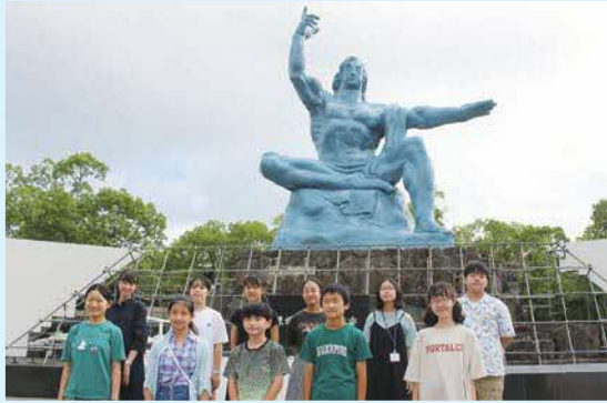
◀ちょうふピース メッセンジャー2022