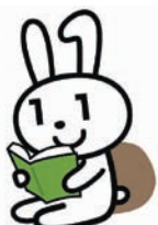
広報用ロゴマーク「マイナちゃん」