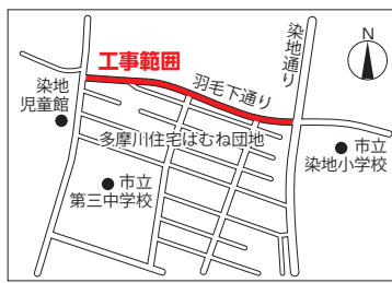
図 道路管理課 ☎481-7409