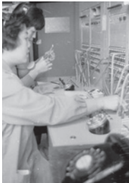
市役所の電話交換手(昭和40年ごろ)