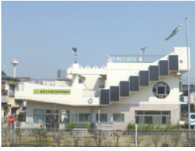
多摩川自然情報館外観

コ☎03-3406-1724（平日午前10時～午後5時30分）、多摩川自然情報館携帯電話☎080-2087-9009（土・日曜日、祝日午前9時～午後5時）（環境政策課）