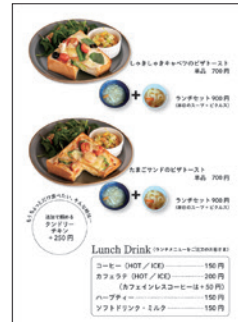
活用例：写真入りメニュー