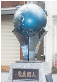
三鷹市中央通り「地球を支える手」

他 持ち帰り可能な梅の量は全体の収穫量に応じて制限あり。状況に応じて開催を中止する場合あり