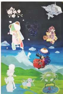
鹿島学園高校の 高校生の合同作品

申6月15日(休)までに直接または電話・Eメール(☎seibuk@w2.city.chofu.tokyo.jp)で申し込み(Eメールの場合は電話番号を明記)※抽選結果は16日(休)以降に連絡