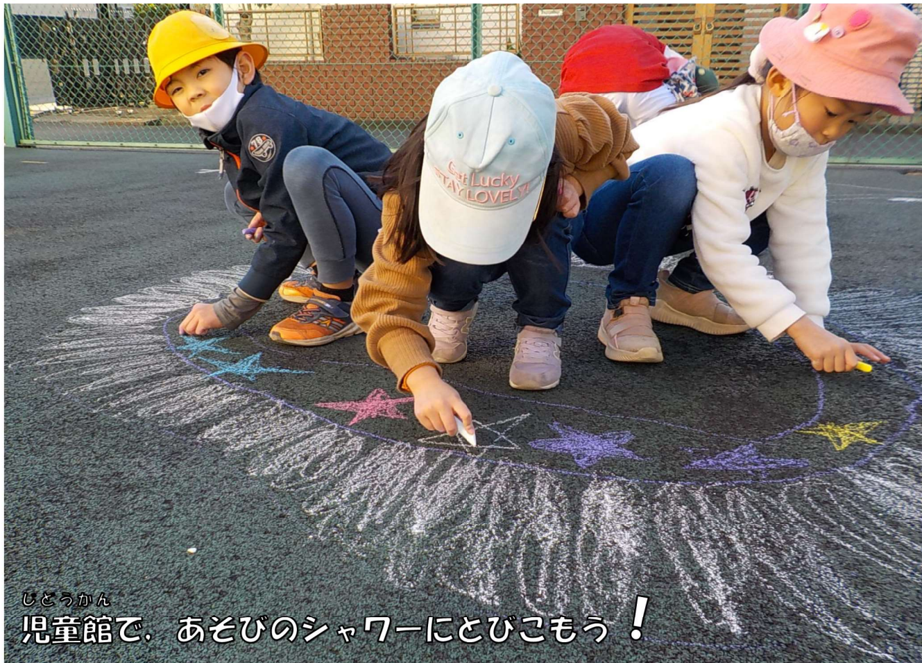
じどうかん 児童館で、あそびのシャワーにとびこもう！