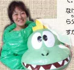
たまがわじどうかん 多摩川児童館 めぐちゃん 好きだった遊び 缶けり、どろけい

小学2年生まで、顔に水がかかるのも嫌なくらいプールが嫌いでした。いつもふちにつかまっているだけの子でした。「検定に受からなければ、夏の旅行は、なし!」と母からの通達が・・・その日から父の特訓が始まりました。おかげで、無事に旅行には行けたのですが、とても嫌な夏の思い出です。ちなみに今でも水は苦手です。