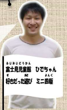
ふじ児童館 ひでちゃん 好きだった遊び ミニ四駆

小学生の時、授業で近くの川にザリガニを取りに行きました。その時みんなは取れなかったけど、僕だけ1匹取れたのです。すごく嬉しくて「また取るぞー」と思って、学校から帰って近くの川へ虫かごを持って出かけました。一生懸命探したけど、その日は1匹も見つけられず家へ帰りました。家に帰ると、空っぽなはずの虫かごに、なんとヒルが3匹入っていたのです。それを見つけた母に・・・しかられました。