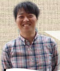
じんせいじどうかん 深大寺児童館 としさん 好きだった遊び ホードゲーム

祖母の家近くの森で、カブトムシ捕りをするのが大好きでした。午前中、木に蜂蜜を塗ると、夜にはたくさんの虫が集まってきます。夜の森は怖いけど、それ以上にワクワクする気持ちがあったなあとおもひかしい思い出です。