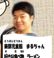
とうほう児童館 まるちゃん 好きだった遊び ラーメン