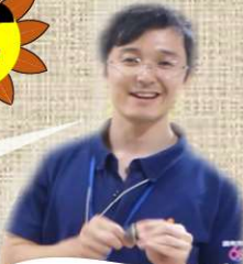
くりにょうじどうかん 国領児童館 こうちゃん 好きだった遊び カードゲーム

夏休みは、いとこの家がある山梨県に遊びに行っていました。そこでは、川遊びをしたり、原っぱを駆け回ったり、夜には星空を眺めたり・・・自然を思いっきりマンキツしていました。