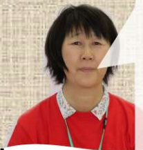
つづけ児童館 けーちゃん 好きだった遊び 缶けり

20数年前、新潟県の柏崎の海で、釣りをしました。東京では、お刺身で食べるのできないキスを釣りました。50匹くらいは三枚おろしにしてお刺身に、あと50匹はてんぷらにして食べました。それからそのおいしさ忘れられなくて、最近は千葉県の本更津でキスを釣っています。