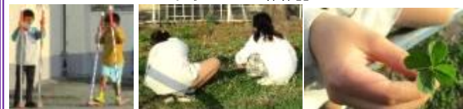
校庭で竹馬に挑戦！