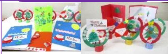
クリスマス工作品