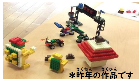
さくねん さくひん *昨年の作品です

しせつ うえのはら きたのだい たきざか ちょうわ じんだいじ ごうどう *5施設：上ノ原・北ノ台・滝坂・調和・深大寺の合同コンテストです。