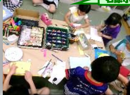
「サンキューカード」を作りました。