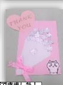
ステキな作品ができました！

すてきな本がたくさん送りました！ (あそびバ職員による寄付です。) みんな、読みきってね〜♪