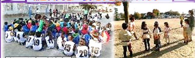
ドッチビー交流会