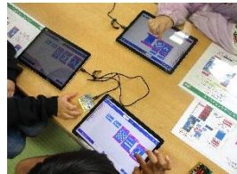
プログラミング教室