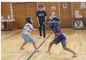
スポーツチャンバラ

東京都や調布市の専門の講師の方を招いて、教室を開きました。いつもと違った体験にみんな楽しく参加しました♪