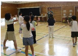
スポーツコーディネーション 体験