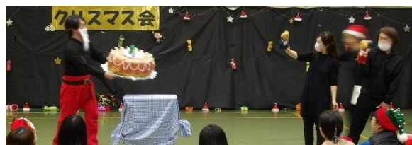
『ぐりとぐらのおきゃくさま』