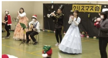
『おもちゃのチャチャチャ』