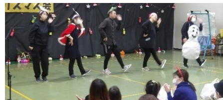
『クリスマスの歌がきこえてくるよ』